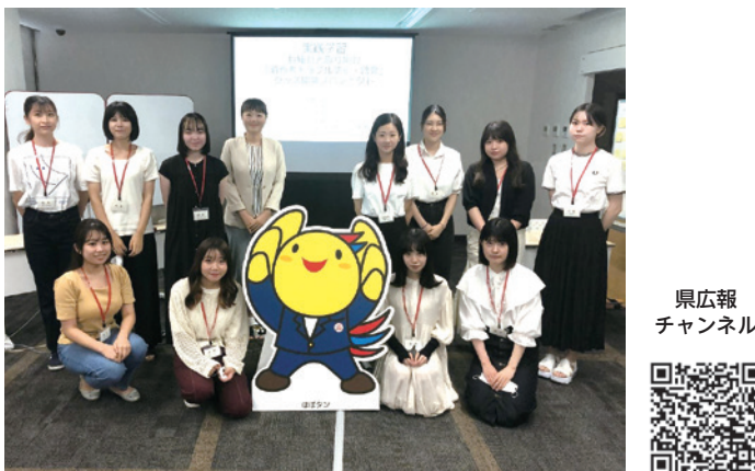
写真 参加した学生の皆さん

https://hyogo-ch.jp/video/4489/?doing_wp_cron=1676958725.9162290096282958984375